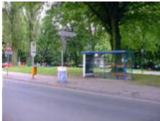
Bushaltestelle am St. Josef-Hospital in Fahrtrichtung Bochum Hauptbahnhof

St. Josef-Hospital in Richtung BO-Hbf, BO-Eppendorf, Munscheider Straße: