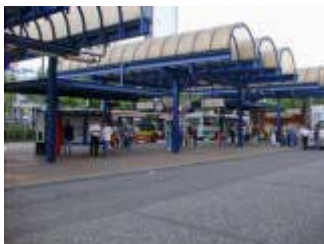
Busstation am Bochumer Hauptbahnhof

Abfahrtszeiten Buslinie 354: BO-Hbf in Richtung St. Josef-Hospital, Richtung BO-Riemke, Zillertal, Nokia: